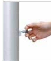
Entsperrstift ziehen, Riegel nach unten schieben: ENTSICHERN

Das patentierte Kurbel-Hissystem FlagLift besteht aus dem Kompaktantrieb mit VA-Antriebsrad, dem VA-Hissseil und dem Langschlitten mit Federvorspannung. Alle Bauteile befinden sich in der Mastnut. Die Seilarretierung wird durch eine Federbremse bewirkt, die durch einfaches Anheben des Sicherungsriegels das Antriebsrad blockiert und den Steckerzug für die Handkurbel verschleißt. Die Entriegelung erfolgt mittels eines Spezial-Entsperrstiftes in einem Handgriff.