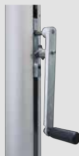
Kurbelhissvorrichtung FlagLift Handkurbel