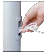
Nach dem Hissen Seil in Schlaufen legen und als Bund in das Bediengehäuse stecken.