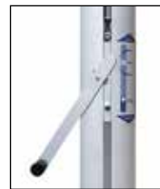
Kompaktantrieb, Handkurbel mit Entsperrstift