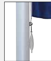
Untersten Karabiner – zusammen mit Fahnenstraffergewicht in Öse des untersten Fahnentuchhalters einhaken.