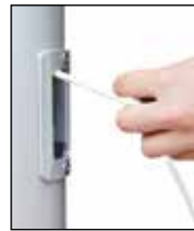
Hissen der Fahne durch horizontales Ziehen, Einholen durch Loslassen.

Die klassische Innenseilführung mit dem im Mastrohr laufenden PES-Hissseil. Die Handhabung des Hissseiles erfolgt über das Bediengehäuse mit (SchnellFixierSystem) -SFS mit sperrbarem Türchen. Hissen und Abnehmen der Fahnen erfolgt durch Ziehen bzw. Nachlassen des Hissseiles. Bei Loslassen arretiert das Hissseil selbsttätig in der Spezial-Seilklemme im SFS-Gehäuse.