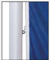
Mittleren Karabiner in die Ösen der Fahnentuchhalter einhaken.