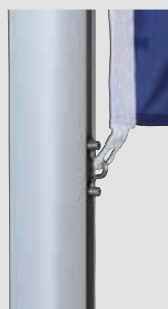
Zubehör: Fahnenstraffer, unverlierbar