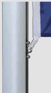
Zubehör: Fahnenstraffer, unverlierbar