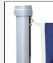
Obersten Fahnenkarabiner in Öse des Zugschlittens einhaken.

Es können alle gängigen, frei auswehenden Fahnen gehisst werden. Die maximal zulässigen Fahnengrößen sind unter den technischen Daten aufgeführt. Abgespannte Bannerfahnen sind grundsätzlich ab 7 Beaufort (50 – 61 km/h) Wind abzunehmen.