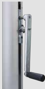
Kurbelhissvorrichtung FlagLift Handkurbel